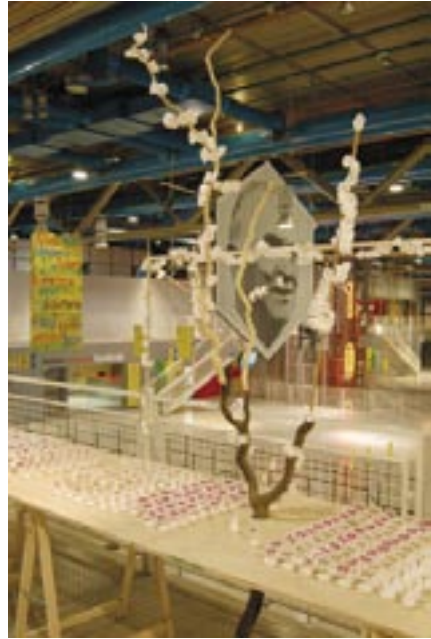
Installation à la Boutique Printemps Design du Centre G. Pompidou. Nov. 2006