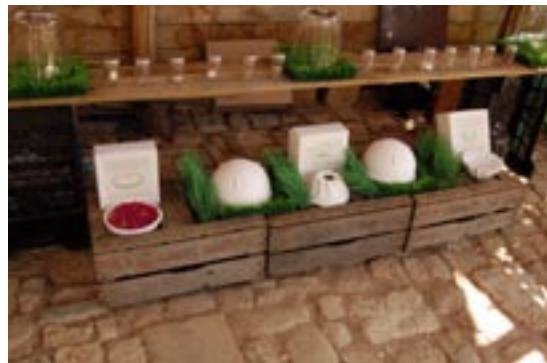
Installation fraîche au jardin d'Adoué. Mai 2007.